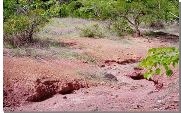
บริเวณที่พบ

ลักษณะโดยทั่วไป : เนื้อดินบนเป็นดินร่วนปนทราย ดินล่างเป็นดินเหนียวปนลูกรังหรือเศษ หิน ทราย ดินมีสีน้ำตาลหรือเหลือง ใต้ลงไปเป็นดินเหนียวสีเทา มีจุดประสีน้ำตาล สีแดง และสีลาแกอ่อนปะปนอยู่ ด้วยเป็นจำนวนมาก อาจพบชั้นหินทรายหรือหินดินดานที่ผุพังสลายตัวในชั้นถัดไป พบบริเวณพื้นที่ดอน มีลักษณะเป็นลูกคลื่น มีความลาดชัน 3 - 20 % เป็นดินตื้นถึงตื้นมาก มีการระบายน้ำดีระดับน้ำใต้ดินอยู่ลึกกว่า 2 เมตร มีความอุดมสมบูรณ์ตามธรรมชาติค่า Ph 5.0 - 6.5 ส่วนใหญ่เป็นป่าเต็งรัง บางแห่งใช้ปลูกพืชไร่และไม้โตเร็ว พืชธรรมชาติ ได้แก่ ชุดดินโพนพิสัย และสกล, บรบี้อ ปัจจุบันบริเวณดังกล่าวใช้ปลูกพืชไร่ พืชธรรมชาติ ที่รกร้างว่างเปล่า ป่าเต็งรัง หรือใช้ปลูกไม้โตเร็ว