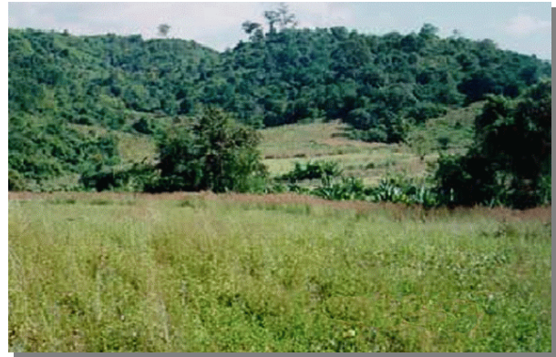
บริเวณที่พบ

ลักษณะโดยทั่วไป : เนื้อดินเป็นพวกดินเหนียวหรือดินร่วน ที่มีเศษหินปะปนมาก และพบชั้นหินพื้นลึก 50 - 80 ซม. ดินมีสีน้ำตาล สีน้ำตาลปนแดง เกิดจากการสลายตัวผุพังของหินเนื้อละเอียด มีสภาพพื้นที่เป็นลูกคลื่นลอนลาดถึงเนินเขา มีความลาดชันประมาณ 2 - 20 % เป็นดินต้น มี การระบายน้ำดี ระดับน้ำใต้ดินอยู่ลึกกว่า 3 เมตรตลอดปี มีความอุดมสมบูรณ์ตามธรรมชาติต่ำถึง ปานกลาง pH 5.0-7.5 ส่วนใหญ่เป็นป่าเบญจพรรณและป่าเต็งรัง บางแห่งทำไร่เลื่อนลอย หรือปลูกป่าทดแทน ได้แก่ ชุดดินสี มวกเหล็ก นครสวรรค์ ท่าลี่ สบปราบ และไพศาลี หินซ้อน โคนปรีด โป่งน้ำร้อนงาว ปัจจุบันบริเวณดังกล่าวเป็นป่าเบญจพรรณ ป่าเต็งรัง หรือป่าละเมาะ บางแห่งใช้ทำไร่เลื่อนลอย หรือปลูกป่าทดแทน