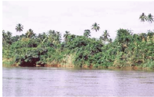
บริเวณที่พบ

ลักษณะโดยทั่วไป : หน่วยที่ดินเป็นกลุ่มชุดดินที่มีเนื้อดินเป็นพวกดินร่วน ดินร่วนเหนียวปนทรายแป้ง บางแห่งอาจมีชั้นดินทรายละเอียดสลับชั้นอยู่ พบในเขตฝนตกชุก เช่น ภาคใต้ สีดินเป็นสีน้ำตาลหรือสีเหลืองปนน้ำตาลและมักมีแร่ปะปนกับเนื้อดิน เกิดจากตะกอนดินที่น้ำพัดมาทับถมบริเวณสันดินริมน้ำ ซึ่งมีสภาพพื้นที่ค่อนข้างราบเรียบถึงเป็นลูกคลื่นลอนลาดเป็นดินลึกมากมีการระบายน้ำดี มีความอุดมสมบูรณ์ตามธรรมชาติค่อนข้างต่ำ ปฏิกิริยาดินเป็นกรดจัดถึงเป็นกรดแก่ มีค่าความเป็นกรดเป็นด่าง ประมาณ 4.5-5.5 ปัจจุบันบริเวณดังกล่าวใช้ปลูกยางพารา กาแฟ และไม้ผลชนิดต่าง ๆ ไม่ค่อยมีปัญหาในเรื่องคุณสมบัติของดิน แต่อาจมีปัญหาเรื่องน้ำท่วม สร้างความเสียหายให้แก่พืชผลที่ปลูก หากน้ำในลำน้ำมีปริมาณมากจนไหลเอ่อท่วมตลิ่ง และแช่ขังอยู่เป็นเวลานาน ตัวอย่างชุดดินที่อยู่ในกลุ่มนี้ได้แก่ ชุดดินรือเสาะ ชุดดินลำแก่น ชุดดินตาขุน