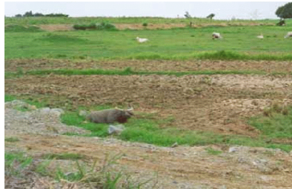
บริเวณที่พบ

ลักษณะโดยทั่วไป : หน่วยที่ดินเป็นกลุ่มชุดดินที่มีเนื้อดินเป็นพวกดินทราย มีสีน้ำตาลปนเทาหรือสีเทาปนชมพู พบจุดประสีน้ำตาล สีเหลืองหรือสีเทาในชั้นดินล่าง บางแห่งจะพบชั้นที่มีการสะสมอินทรีย์วัตถุ เป็นชั้นบาง ๆ มีสภาพพื้นที่ค่อนข้างราบเรียบหรือราบเรียบ เป็นดินลึก มีการระบายน้ำค่อนข้างเร็วถึงปานกลาง มีความอุดมสมบูรณ์ตามธรรมชาติต่ำมาก ปฏิกริยาดินเป็นกรดปานกลางถึงเป็นกรดเล็กน้อย มีค่าความเป็นกรดเป็นด่างประมาณ 5.5-6.5 ปัจจุบันบริเวณดังกล่าวใช้ทำนา หรือปลูกพืชไร่บางชนิด เช่น มันสำปะหลัง อ้อยและปอ บางแห่งเป็นทุ่งหญ้าธรรมชาติ ตัวอย่างชุดดินที่อยู่ในกลุ่มนี้ได้แก่ ชุดดินอุบล ชุดดินบ้านบึง ชุดดินท่าอุเทน