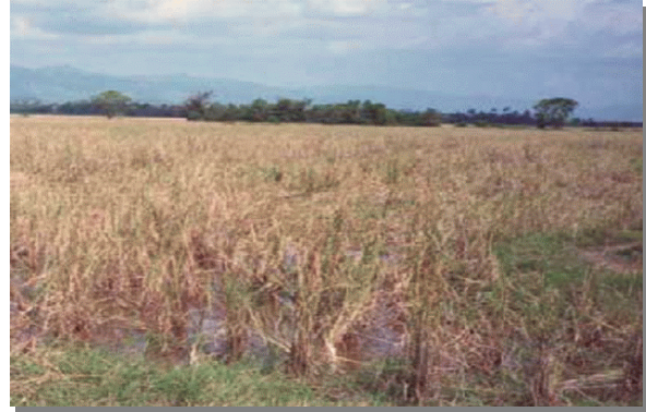
บริเวณที่พบ

ลักษณะโดยทั่วไป : เนื้อดินเป็นพวกดินทราย บางแห่งมีเปลือกหอยปะปนอยู่ในดินชั้นล่าง สีดินเป็นสีเทา พบจุดประสีน้ำตาลหรือสีเหลืองปะปนอยู่ในดินชั้นล่างเกิดจากวัตถุต้นกำเนิดดินพวกตะกอนน้ำทะเล พบในบริเวณที่ลุ่มระหว่างสันหาด หรือเนินทรายชายฝั่งทะเล น้ำแช่ขังลึก 30-50 ซม. นาน 4 - 5 เดือน เป็นดินลึก มีการระบายน้ำเลวถึงเลวมาก มีความอุดมสมบูรณ์ตามธรรมชาติต่ำ pH ประมาณ 6.0-7.0 แต่ถ้ามีเปลือกหอยปะปนอยู่ pH จะอยู่ 7.5-8.5 ได้แก่ชุดดินวังเปรียง และบางละมุง