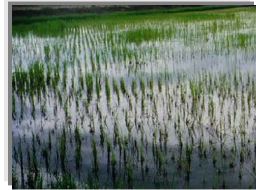
บริเวณที่พบ

ลักษณะโดยทั่วไป : เนื้อดินเป็นพวกดินเหนียว ดินบนมีสีดำหรือเทาแก่ ดินล่างมีสีเทาและมีจุดประสีน้ำตาล สีเหลือง หรือสีแดงปะปนอยู่เป็นจำนวนมากในช่วงดินล่างตอนบน และพบจุดประสีเหลืองฟางข้าวของสารจาโรไซต์ ในระดับความลึก 50-100 ซม. จากผิวดิน พบบริเวณที่ราบตามชายฝั่งทะเลหรือที่ราบลุ่มภาคกลาง น้ำแช่ขังลึก 50-100 ซม. นาน 3-5 เดือน บางพื้นที่จะขังน้ำนาน 6-7 เดือน เป็นดินลึก มีการระบายน้ำเร็ว มีความอุดมสมบูรณ์ค่อนข้างต่ำ ดินมีปฏิกิริยาเป็นกรดจัดมาก ถึงเป็นกรดจัด pH 4.5-5.0 ได้แก่ชุดดินรังสิต เสนา รัชบุรี ชุดดินดอนเมือง ปัจจุบันบริเวณดังกล่าวใช้ทำนา บางแห่งยกร่องปลูกพืชผัก ส้มเขียวหวาน และสนประดิพัทธ์ ถ้าดินเหล่านี้ได้รับการปรับปรุงบำรุงดินใช้ปุ๋ยและปูนในอัตราที่เหมาะสม และมีการควบคุมน้ำ หรือจัดระบบชลประทานที่มีประสิทธิภาพ พืชที่ปลูกจะให้ผลผลิตดีขึ้น